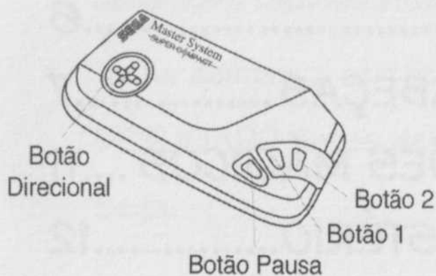
Master System III Compact